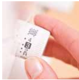
Réglage de la largeur de point