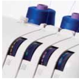
Guide d'enfilage avec repères en 4 couleurs