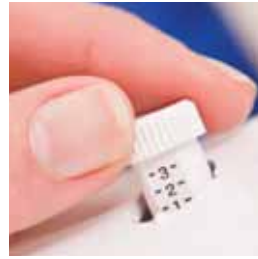
Contrôle de la pression du pied presseur