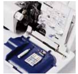
Rangement astucieux des accessoires