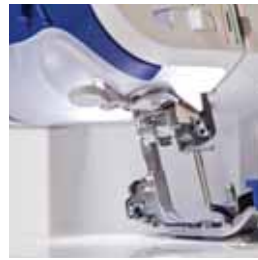
Eclairage par LED du plan de travail