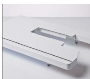
Table d'extension extra-large

Recommandée pour toutes les applications nécessitant une plus grande visibilité. Sa large ouverture permet divers positionnements de l'aiguille à gauche et à droite.