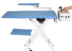
ABBINATO AL TAVOLO